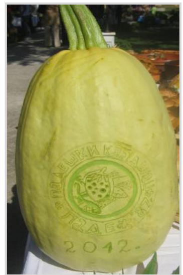
Сабор народног стваралаштва