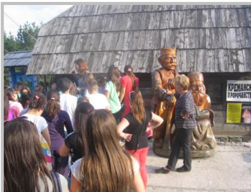
О Креманском пророчанству