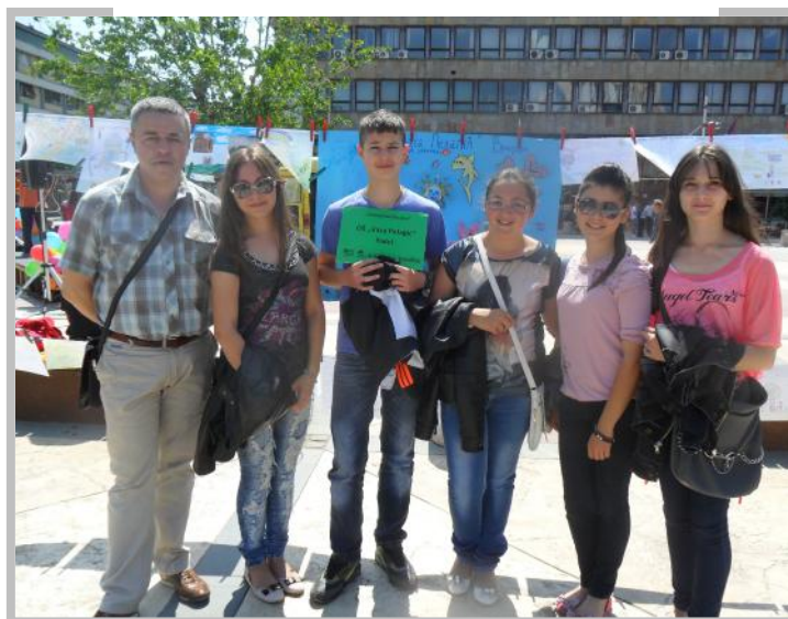
Наставници и ученици наше школе