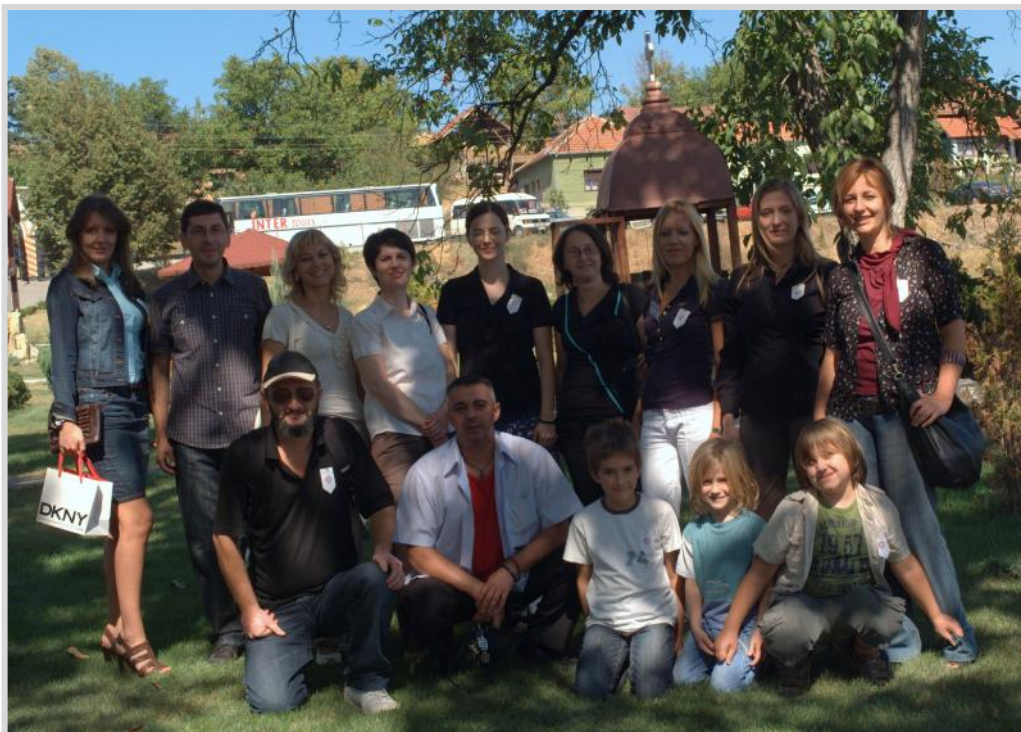
Део колектива ОШ „Васа Пелагић“