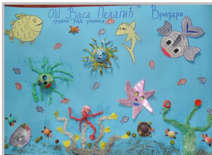
Победнички рад ученика из Вратара