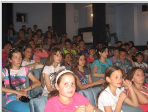
У биоскопу у Међавнику

Изведена је дводневна екскурзија за ученике предметне наставе. По одлуци Савета родитеља изабрана је Туристичка агенција „Планета“ из Крушевца. Релација је била следећа: Падеж- Чачак – Мокра гора – Шарганска осмица - Кремна - Бајина Башта (ноћење) - Перућац – Врело – Златибор – Сирогојно – Стопића пећина – Падеж. Два дана путовања била су богата садржајима са којима су се ученици упознали. И ученици и родитељи су се касније изјаснили да су задовољни изведеном