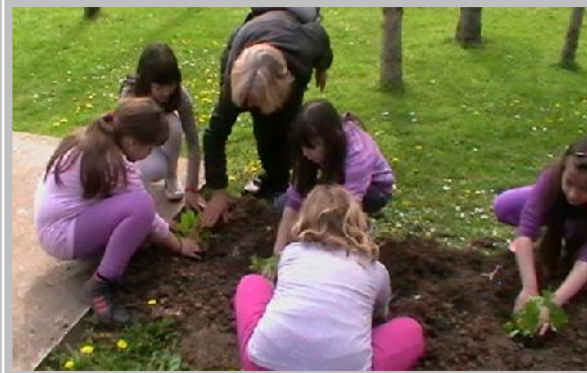
Сађење цвећа и чишћење дворишта - Падеж